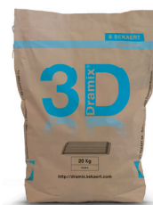
Säcke a 20 kg