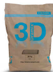
Säcke a 20 kg