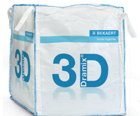
BIG BAG a 800 kg